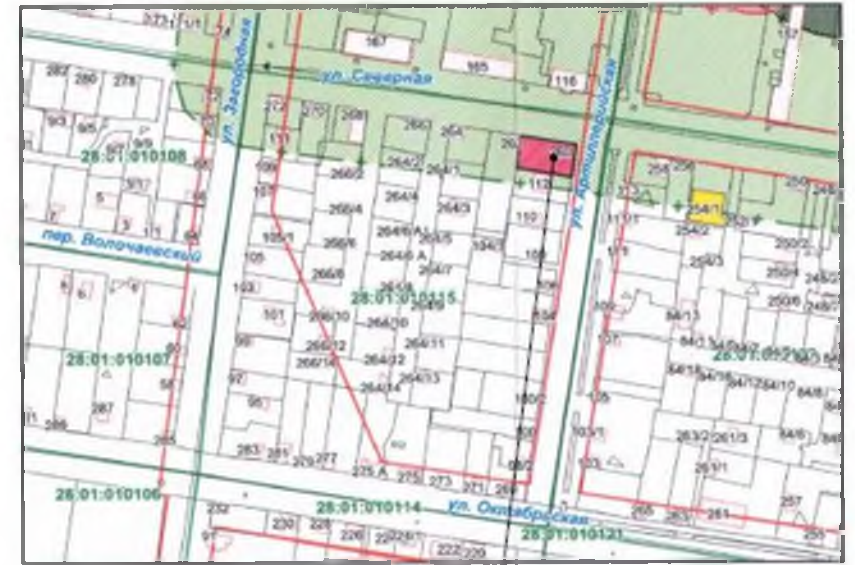
Участок строительства с кадастровым номером 28.01.010115.25